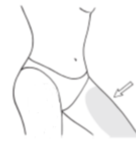
Wewnętrzna strona ud